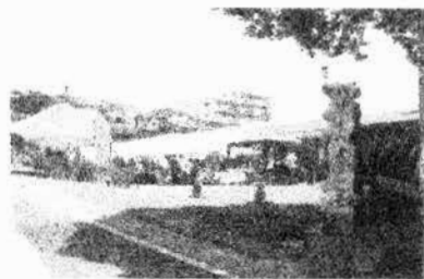
「バザーへようこそ」の 立看板がお迎えです

心配された天候も皆さんのお祈りで晴天になり、 共同体の一致のうちに盛況なバザーとなった。 神に感謝！皆さんに感謝！