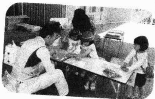
いつも楽しみ ゲームコーナー