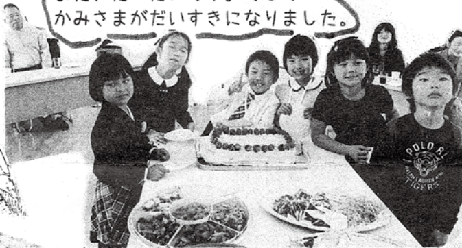
お祝い会の始まりです