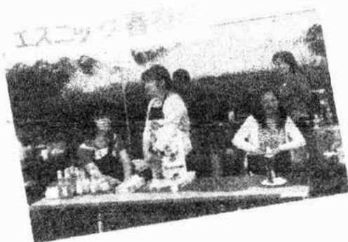
フィリピンの仲間たちも大活躍