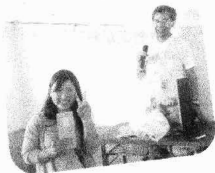
抽選会 今年も当たりました！！