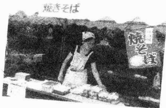
「やきそば」おいしいですよ