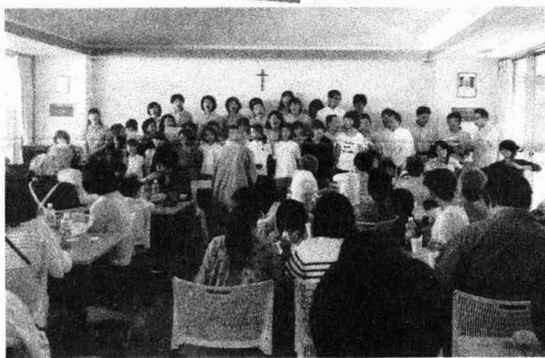
笹丘ファミリア合唱団「花は咲く」 いつ聞いても最高！！