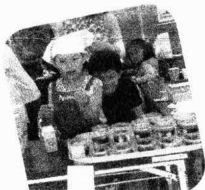
みたらし団子いかがですか