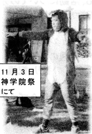
11月3日 神学院祭 にて